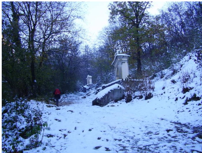
Salita per la Via Crucis che porta al Santuario della Madonna alla Rovinata

Percorrendo tutta la via Crucis si arriva alla baita , dopo aver passato il Santuario della Madonna alla Rovinata. Tempo di percorrenza dall’ospedale \frac{3}{4} d’ ora. La sola via crucis \frac{1}{2} ora.