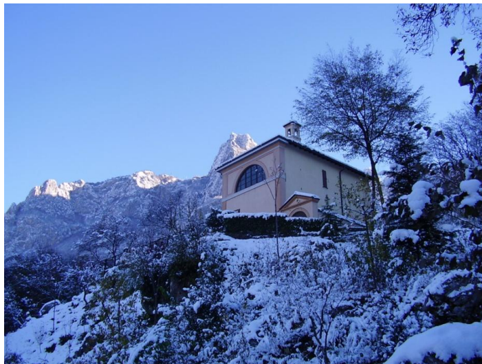
Vista del Santuario Madonna alla Rovinata durante la salita della via Crucis.